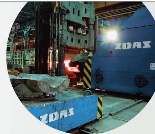
Vývoj Železiarne Podbrezová Group

Železiarne Podbrezová ŽP Tažirny trub Svinov ŽDAS Žďár nad Sázavou TS Plzeň ŽIAROMAT Kalinovo ŽP PRAKO Prakovce